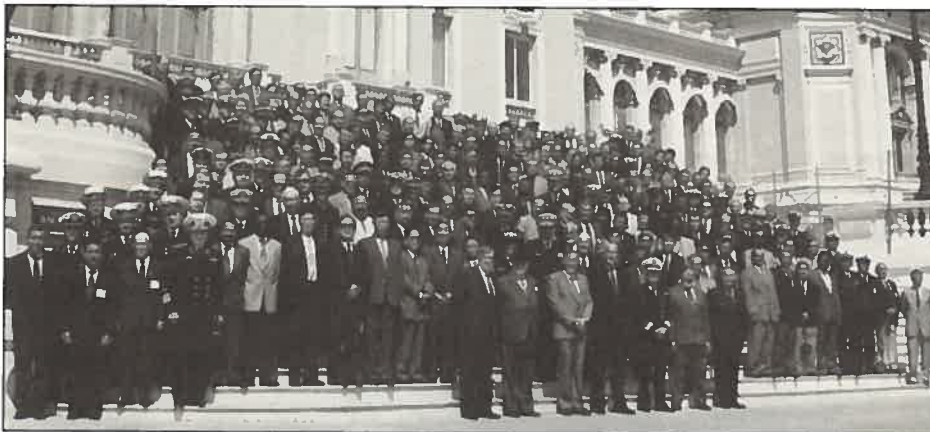
Fotografia Oficial da XV Conferência Hidrográfica Internacional - Mónaco - 14 a 25 Abril 1997