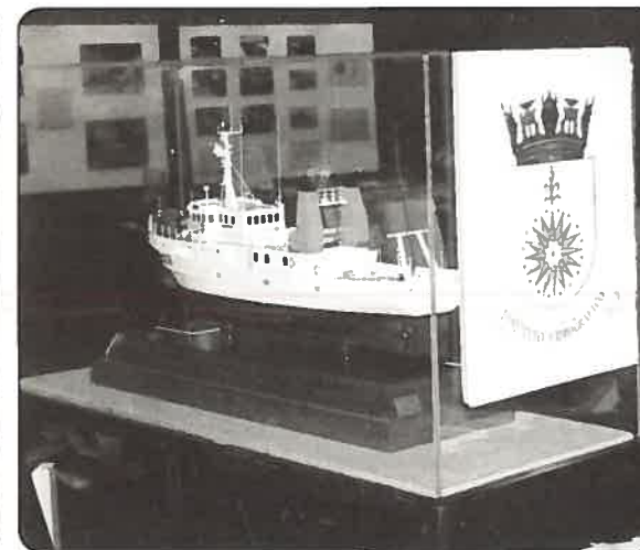
Modelo do NRP «Andrómeda»