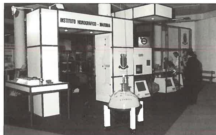
Vista geral do «stand» do IH na EXPOAMBIENTE/97

Para além desta mostra, decorreram entretanto manifestações paralelas, sob a forma de seminários e «workshops», mais dedicados aos profissionais e que constituíram um espaço amplo de debate e informação sobre questões ligadas com a Defesa e Protecção do Meio Ambiente.