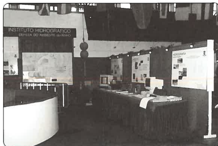
Aspecto geral do espaço reservado ao IH

No dia 8, ponto alto das comemorações, a Marinha formou no Barreiro junto do rio Tejo, cerimónia militar que terminou com um desfile das forças em parada.