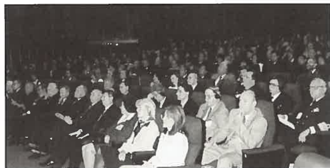
Sessão de Abertura da XV Conferência Hidrográfica Internacional