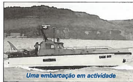
Uma embarcação em actividade

Estão a ser executadas campanhas de colheita de amostras inseridas nas campanhas de vigi- lância do meio mari- nho nos rios Tejo e Sado, com um bote Zebro III.