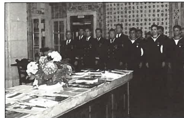
Oficiais, sargentos e praças agraciados com a Medalha NATO