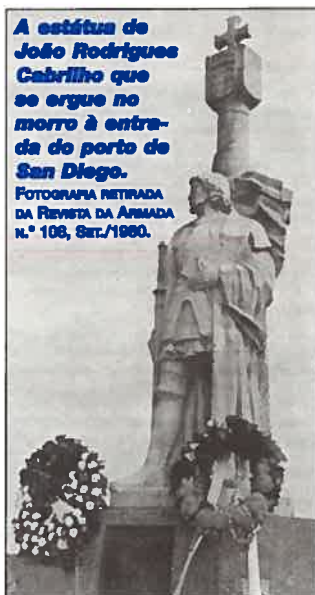
A estátua de João Rodrigues Cabrilho que se ergue no morro à entrada do porto de San Diego.

A organização do Festival é o resultado de uma estreita cooperação entre comunidade luso-americana radicana em San Diego, as autoridades, organismos e serviços locais, que se espera continue a existir.