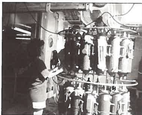
O momento da recolha de água trazida pela rosette.

Além dos dados hidrológicos recolhidos, foram ainda lançadas a água bóias derivantes e sistemas RAFOS para seguimento de vórtices de água mediterrânica. Esses vórtices foram encontrados por meio da análise de perfis de temperatura e salinidade dos dados hidrológicos, bem como por lançamento de XBT e XCTD.