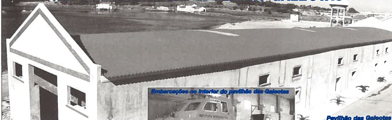
Embarcações no interior do pavilhão das Galeotas