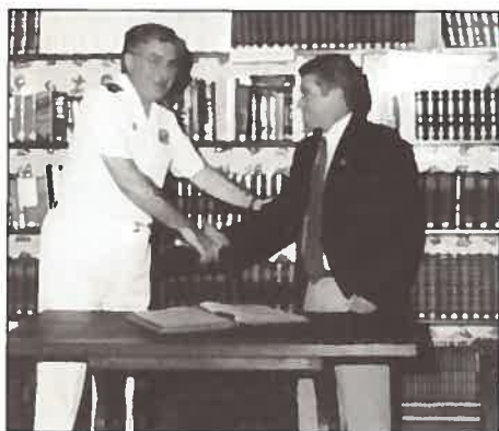
◀ O Director-Geral do IH e o Director de Hidrografia e Navegação da Marinha do Brasil, após a assinatura do Livro de Honra na Biblioteca.

Se o que vale na vida é o sentimento, não duvidaria em dizer que esta visita carrega dentro de si todo o respeito e profunda admiração pela Marinha portuguesa e, também, infinita saudade...»