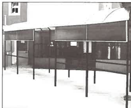
O abrigo da passagem entre a Secretaria de Pessoal e o Pátio da Divisão de Química.

Evidenciam-se como exemplos os trabalhos de apoio à investigação já efec-tuados, tais como o da manufactura da estrutura para fundeamento do correntó-metro de efeito de Doppler – RDI adquiri-do no corrente ano e ao serviço da Ocea-nografia, ou o do correntómetro de efeito Doppler da MORS, a manufactura de um sistema com depósito para vácuo para um