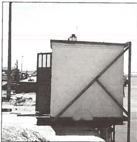
Aspecto exterior e interior do marégrafo no cais do Terreiro do Trigo.