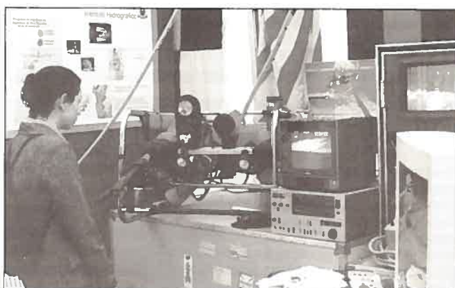
Outro aspecto da exposição apresentada pelo IH.

Embora tenha decorrido apenas durante um dia, esta mostra teve bastante sucesso, recebendo a visita de muitas pessoas interessadas e vindas de diferentes zonas do país, devido ao facto de Belém ter sido o local escolhido para a realização de vários outros eventos integrados nas Comemorações do Dia 5 de Outubro.