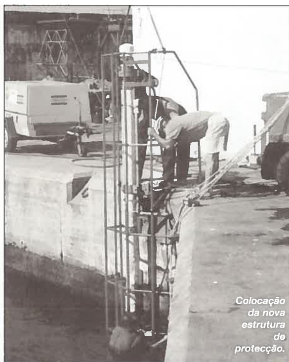
Colocação da nova estrutura de protecção.