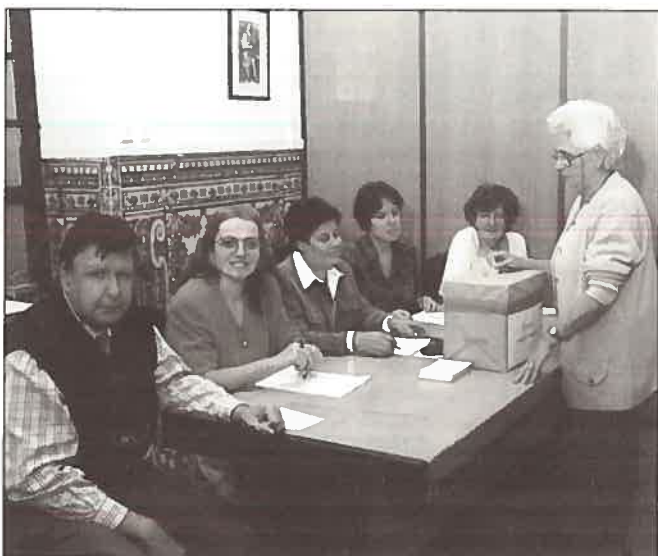
A primeira votação, na eleição da primeira Comissão Paritária do IH.

Dando cumprimento à legislação em vigor, designadamente ao estabelecido no ponto 3, do artigo 25.º do decreto regulamentar 44-B/83 de 1 de Junho, decorreu no passado dia 20 de Outubro de 1998, o acto eleitoral destinado a eleger os representantes dos funcionários civis deste Instituto que irão integrar a Comissão Paritária.