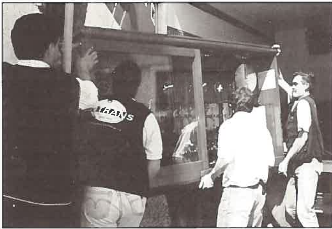
O momento em que me transportaram no meu regresso a casa.