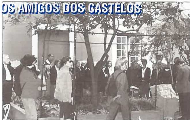
O grupo da APAC na sua passagem pelo jardim do Convento das Trinas.

Aproveitemos o exemplo deste grupo e gozemos este património que, embora do país, é também nosso.