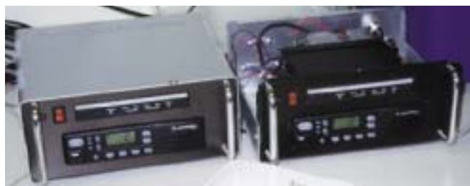
Fig. 5 - Sistema de ligação de dados para DGPS

Ainda na área do posicionamento é de realçar a utilização de sistemas integrados de posicionamento e atitude, capazes de fornecer informação integrada de proa, posição, balanço ( roll ), cabeceio ( pitch ) e arfagem ( heave ), com exactidões significativamente melhores que as anteriores configurações, envolvendo sensores de movimentos simples, girobússolas e receptores GPS de uma forma independente. Estes novos sistemas, com base na existência de dois receptores GPS e de um sensor de movimentos, em associação com a electrónica adequada à sua integração e com um conjunto de firmware que implementa algoritmos de filtros muito complexos, como seja o caso dos filtros de Kalman,