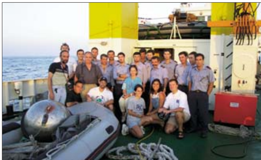
Equipa embarcada e guarnição do NRP Andrómeda