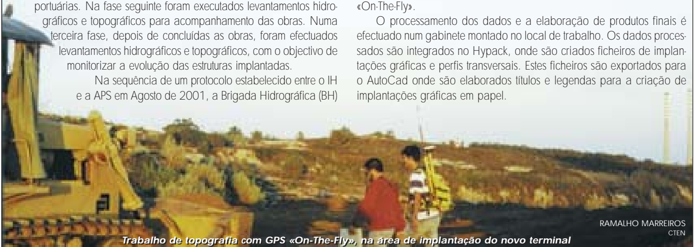
RAMALHO MARREIROS CTEN

O processamento dos dados e a elaboração de produtos finais é efectuado num gabinete montado no local de trabalho. Os dados processados são integrados no Hypack, onde são criados ficheiros de implantações gráficas e perfis transversais. Estes ficheiros são exportados para o AutoCad onde são elaborados títulos e legendas para a criação de implantações gráficas em papel.