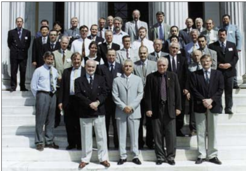
Os participantes na 13.ª Reunião do CHRIS

O NRP Auriga esteve em reparação no Arsenal do Alfeite de Novembro de 2000 a Julho de 2001, efectuando a revisão programada PRO6.