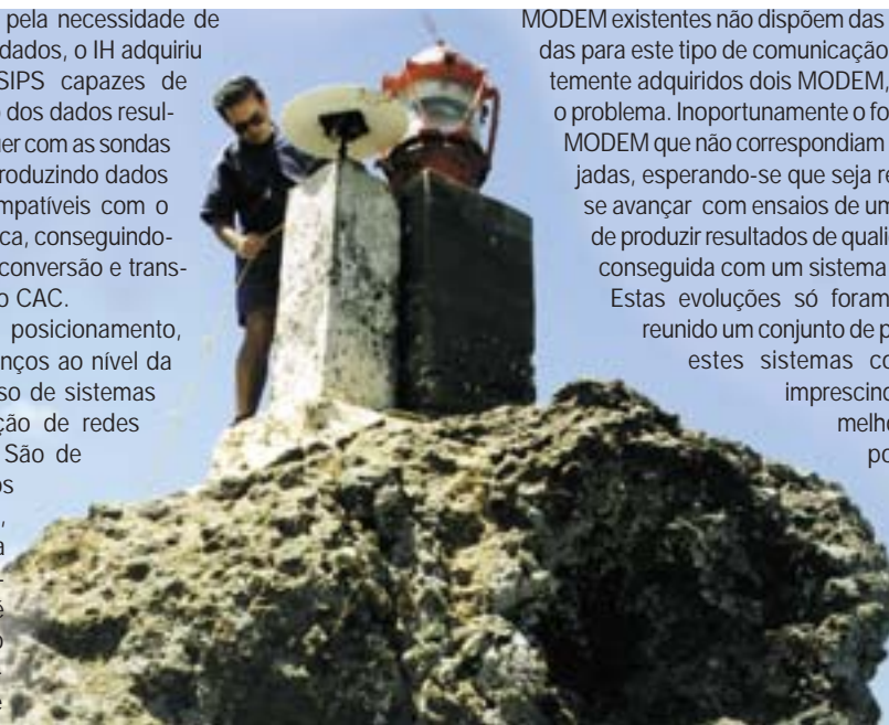
Fig. 3 - Montagem de um GGPS na Selvagem Pequena

MODEM existentes não dispõem das características adequadas para este tipo de comunicação, pelo que foram recentemente adquiridos dois MODEM, com vista a solucionar o problema. Inoportunamente o fornecedor entregou dois MODEM que não correspondiam às características desejadas, esperando-se que seja reposta a situação, para se avançar com ensaios de um sistema em HF, capaz de produzir resultados de qualidade superior à até aqui conseguida com um sistema adquirido no mercado. Estas evoluções só foram possíveis por se ter reunido um conjunto de pessoas que olham para estes sistemas como uma ferramenta imprescindível à continuação dos melhoramentos na área do posicionamento.