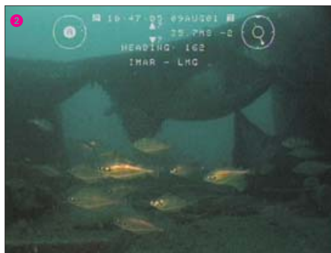
2 Outro aspecto da fauna marinha a cerca de 35 m de profundidade