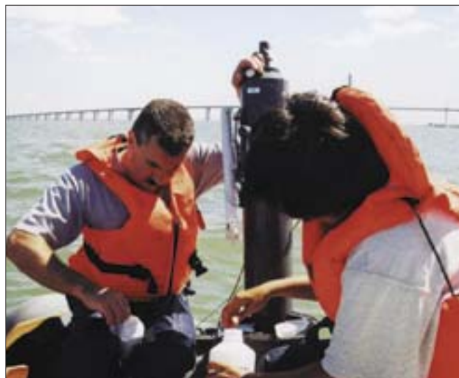
Recolha de amostras de água no rio Tejo

Em 18 de Setembro foi dada colaboração ao projecto SIRIA da Oceanografia, designadamente participando na colheita e conservação de amostras para posterior análise em laboratório. Foram também efectuadas in loco as determinações de oxigénio dissolvido.