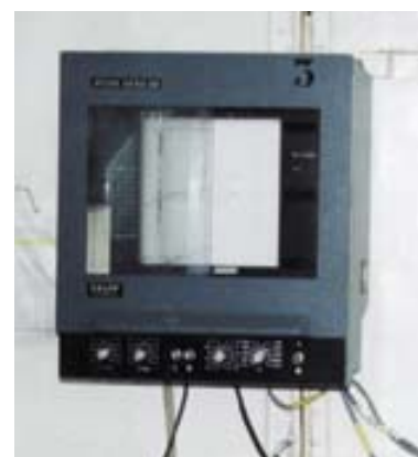
Fig. 2 – Sonda Atlas Deso 20

O IH adquiriu e está a preparar a instalação de um SSMF de grandes fundos no NRP D. Carlos I, que sofrerá as alterações convenientes para o efeito, onde é de salientar a instalação dos transdutores numa gôndola, capaz de suportar a integração dos transdutores de diversos sistemas, como sejam o SSMF, as sondas de feixe simples, a sonda de navegação, dois sistemas ADCP – Acoustic Doppler Current Profiler, um odómetro electromagnético e um sistema de medição em tempo real da velocidade de propagação do som.