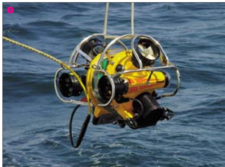
1 ROV do LMG/FCL