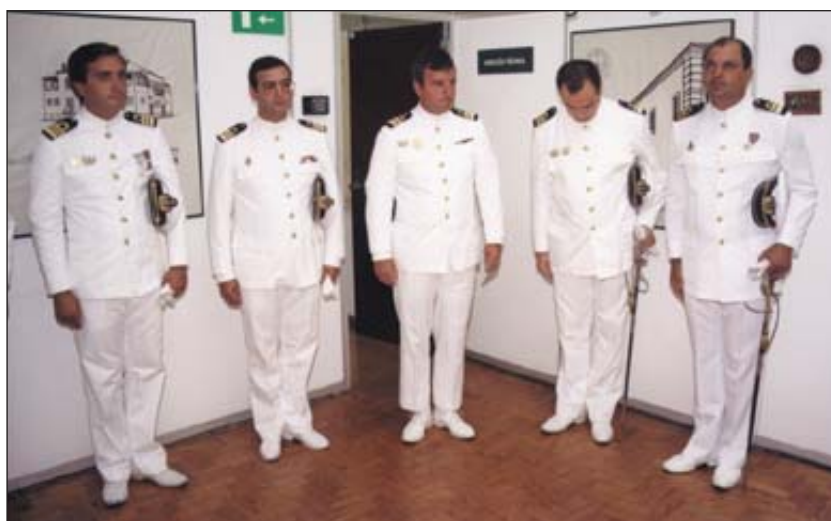
Os anteriores chefes das Divisões de Oceanografia e Navegação (à esq.) e os oficiais que tomaram posse, ladeando o Director Técnico

Habilitado com o curso de Engenheiro Hidrógrafo desde 1996, ingressou então, após frequentar o Curso Geral Naval de Guerra no Instituto Superior Naval de Guerra, na Divisão de Oceanografia do IH, como adjunto do chefe de Divisão, função que desempenhou até à recente tomada de posse.