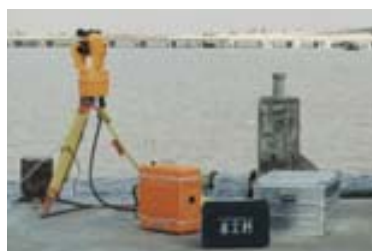
Fig. 4 - Cabeça sensora do POLARFIX

Os resultados têm sido animadores e prevê-se, a curto prazo, avançar para os sistemas de HF, em que o IH dispõe já dos rádios mas os