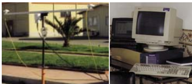
Fig. 1 – Ensaios de um Seapath 200

Como consequência da produção computadorizada de cartas resulta um conjunto de informação em formato digital capaz de ser usada, quer nas novas edições, quer na produção da Carta Electrónica de Navegação Oficial (CENO). Este tipo de carta permite, a quem dispuser de um sistema de informação e visualização de cartas, conhecido internacionalmente por ECDIS – Electronic Chart Display and Information System, efectuar uma navegação assistida por computador.