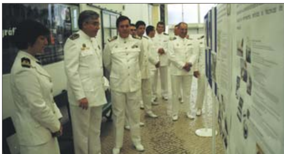
Observando a mostra fotográfica das actividades do IH

Após uma breve passagem pela mostra fotográfica das actividades do IH, no átrio anexo aos Laboratórios, as comemorações do Dia da Unidade foram encerradas com uma visita às instalações do Serviço de Electrotecnia.