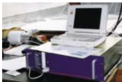
Fig. 6 - Aspecto de funcionamento de um Seapath 200

são de grande fiabilidade e produzem dados muito exactos, necessários às correcções e compensações em sistemas muito exigentes como é o caso dos multifeixes. Estes sistemas são usados, essencialmente, para fornecimento de informação para os sistemas multifeixe. Quando existe necessidade, o que é quase sempre o caso, para sistemas de sondagem a feixe simples recorre-se ao uso de sensores de atitude simples, muitas vezes medindo apenas a componente do balanço arfagem. Na fig. 6 pode ver-se um aspecto dos sistemas integrados, no caso o Seapath 200.